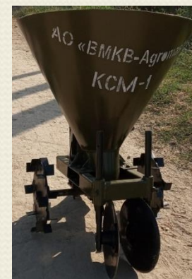
КСМ-1 картошка экич

Мотоблокнинг техник тавсифи Оғирлиги, 115 кг Ишлов бериш чуқурлиги, 14 см Габарит ўлчамлари, 750x376x532 мм Қуввати 12 о.к.