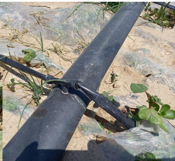
Томчилатиб суғориш тизимининг кўндаланг қувурлари