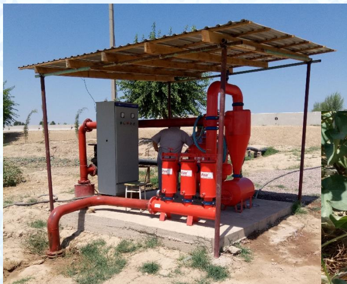
Томчилатиб суғориш тизимининг насос станцияси