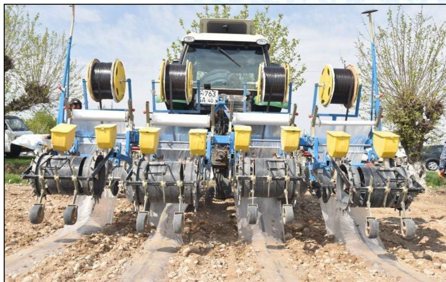
Пленка остига чигит экиш жараёнлари